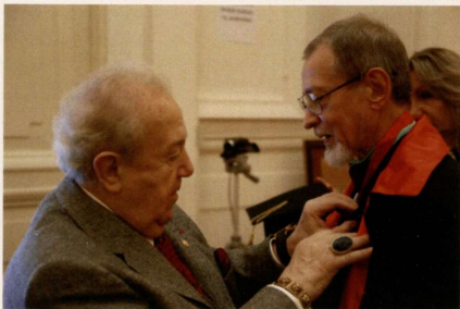
Регалии почетного академика Владимиру Дмитриевичу Добромирову 2 декабря 2015 года вручил народный художник СССР, посол доброй воли ЮНЕСКО, президент Российской Академии Художеств Зураб Церетели