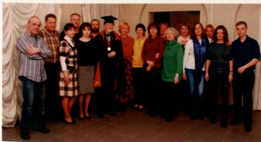
Теперь коллективом руководит Почетный академик РАХ