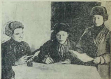
Редколлегия [комсомольской стенгазеты „Ударник полей“ за выпуском очередного номера]

Партийная и комсомольская ячейки развернули массовую работу среди колхозников по проведению сверхраннего сева. В 1933 г. в колхозе впервые должен был проводиться сверхранний сев на площади 249 га.