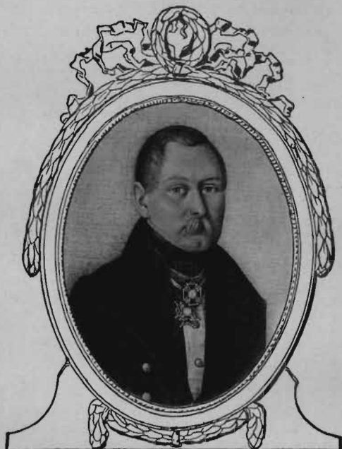
Подполковникъ Карлъ Ивановичъ Рикгофъ.