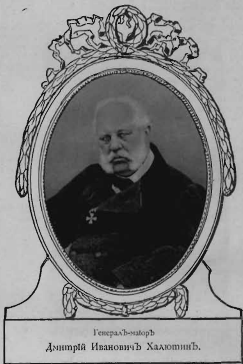
Генералъ-маюръ Дмитрій Ивановичъ Халютинъ.