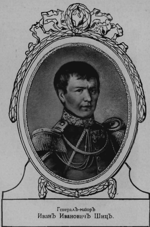
Генераль-маюръ Иванъ Ивановичъ Шицъ.