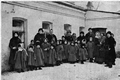
Дѣти-бѣженцевъ, живущія въ пріютѣ Ворон. Общепедагогической Организациі.