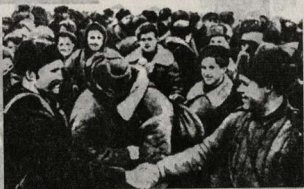
Встреча воинов 255-го стр. полка с партизанами.

Нелегкую службу по защите города несли бойцы МПВО. Они были в таких же условиях, как все ленинградцы. Страдали, мучились, но достойно выполняли свой воинский долг. Тушили пожары, дежурили на крышах домов, вытаскивали из развалин раненых. Ухаживали за больными, убирали город, следили за маскировкой, строили бомбоубежища.