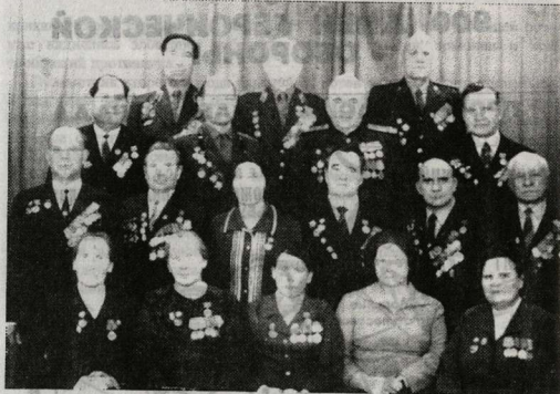
Группа участников по снятию блокады Ленинграда после войны.

Быть первыми во встрече двух фронтов выпало на долю 123 отдельной стрелковой бригады 67 армии Ленинградского фронта и 372 стрелковой дивизии 2 Ударной армии Волховского фронта.