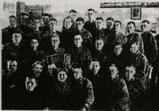
Фронтовые армейские курсы офицеров-политработников. Осельки. Декабрь, 1942 г. Ленфронт.