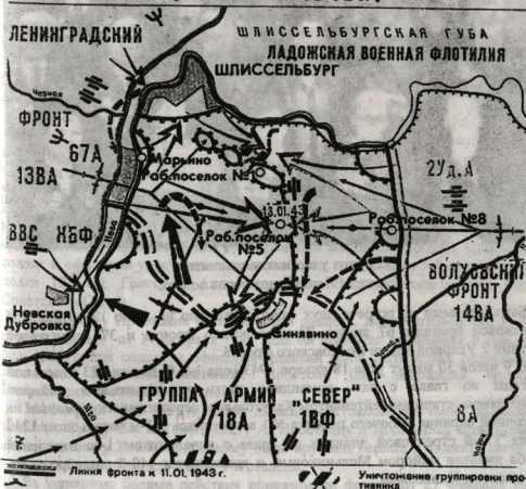
Карта-схема. 900 Дней Героической обороны. Прорыв блокады Ленинграда. (18 января 1943 года).

16 января 1943 года батальоны 269 и 270 полков дивизии Н.П. Симоняка ворвались в Рабочий поселок №5 (со стороны Ленинграда), но немцы упорно сопротивлялись. Части 18 с.д. Волховского фронта, подступавшие с другой стороны, так же стремительно развивали наступление. Коридор между войсками сузился до одного километра.