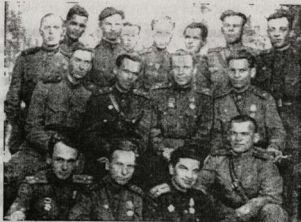
Политработники 123 стр. дивизии.