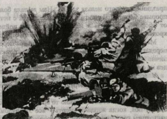
Подвиг восьми героев. С картины художника Т.И. Ксенофонтова

Мечта сбылась. Бойцы и командиры двух фронтов хлынули навстречу друг другу. Объятия и поцелуи прошедших сквозь смерть и огонь мужчин — воинов, никогда не видавших друг друга, состоялись при встрече на освобожденной земле. Блокада прорвана.