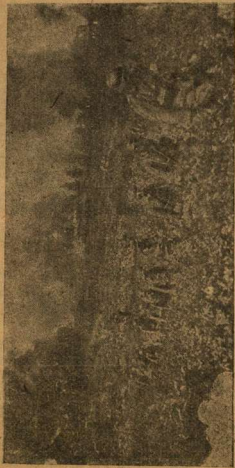
Немецкие бандиты скрывались в нашем городе и селах. (Снимок найден у убитого немецкого солдата).