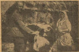
Фашистские мародеры забирают у колхозницы корову.

Фашисты разграбили и сожгли многие машинно-тракторные станции и машинно-тракторные мастерские. Значительная часть тракторов и комбайнов была приведена в негодность.