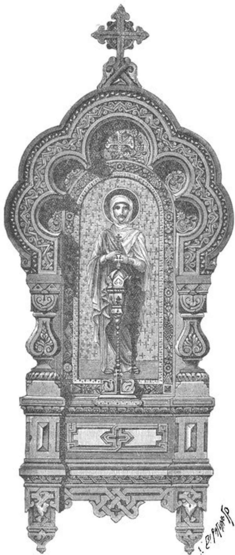
Изъ Мотивовъ Русской Архитектуры.