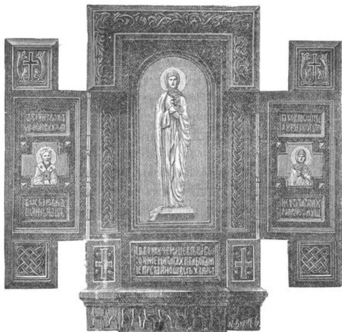
Изъ Мотивовъ Русской Архитектуры.