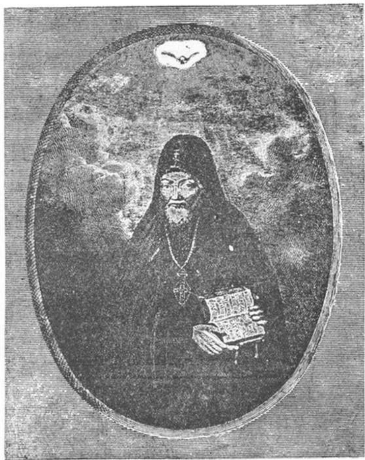
Св. Митрофанъ, первый епископъ Коронезскій.