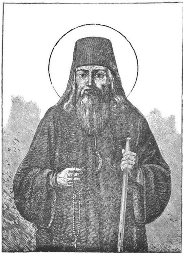
Св. Тихонъ Садонскій.