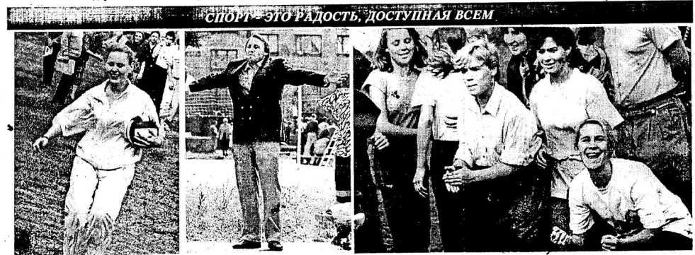
СПОРТ - ЭТО РАДОСТЬ, ДОСТУПНАЯ ВСЕМ