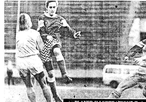
PLAYER ILLUSTRATIONS ©