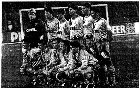
"БАВАРИЯ" ГОТОВА К БОЮ