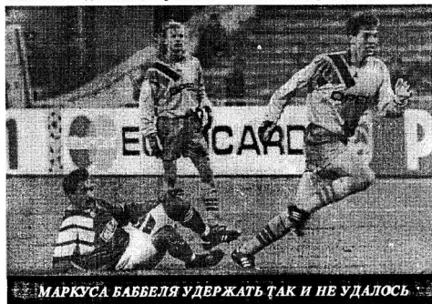
МАРКУСА БАББЕЛЯ УДЕРЖАТЬ ТАК И НЕ УДАЛОСЬ

- Сегодняшняя игра была интересна зрителям. Я отчасти доволен результатом. К сожалению, различие в организации игры и технике паса у команд очевидно.