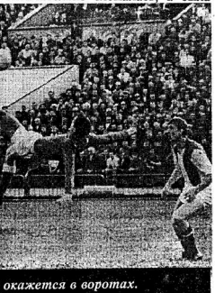
Еще мгноение - и мяч окажется в воротах.