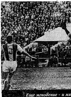
Еще мгноение - и мяч окажется в воротах.