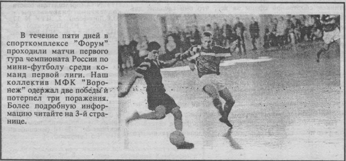
В течение пяти дней в спорткомплексе "Форум" проходили матчи первого тура чемпионата России по мини-футболу среди команд первой лиги. Наш коллектив МФК "Воронеж" одержал две победы и потерпел три поражения. Более подробную информацию читайте на 3-й странице.