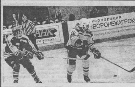
Воронежский "Буран", который многие уже успели похоронить, похоже, возрождается из пепла. Пять лет не проигрывал дома пензенский "Дизелист", но тут приехал "Буран" и испортил всю статистику. Об этих матчах читайте на 10-11-й страницах.

24 и 25 октября "Буран" провел очередные календарные встречи в Тамбове с местным "Авангардом". Их подробности вы узнаете в следующем номере "Игрока".