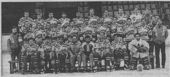
"Буря" Воронеж перед стартом в чемпионате России-95/96.

Вот и пришла пора воронежским любителям хоккея узнать одну из главных новостей межсезонья. Хоккейная команда города Воронежа изменила свое название, и теперь вместо "Бурана" будет именоваться ХК "Воронеж". Это связано с тем, что после нового года команда получила статус муниципальной. Делать какие-то обобщающие выводы еще рано, но не заметить положительных сдвигов, касающихся фламана воронежского хоккея, просто невозможно. Впервые за многие годы хоккеисты и тренеры получили возможность спокойно работать, не ломая голову над тем, когда же им будут выделены зарплата и премиальные. Поэтому команда преобразилась буквально на глазах. Из обремененного аутсайдера, который заслужил репутацию неуступчивого соперника, "Буря" превратился в достойного конкурента сильнейшим клубам российского первенства.