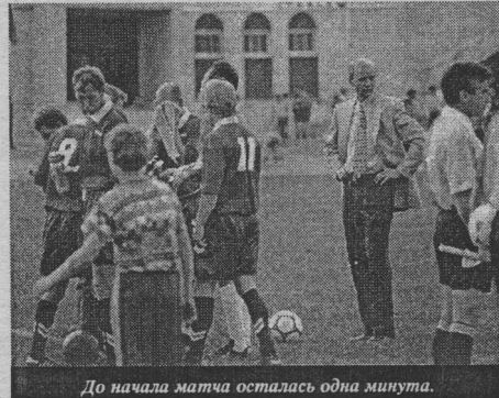
До начала матча осталась одна минута.