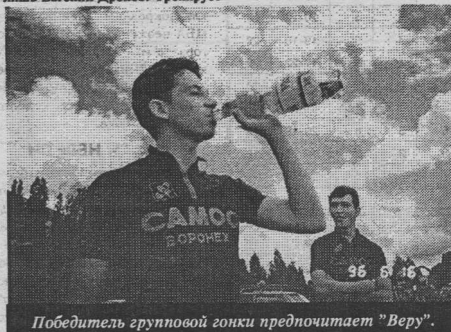
Победитель групповой гонки предпочитает "Веру".

Старшие юниоры (80 км). По ходу гонки несколько велосипедистов ушли в отрыв, и на