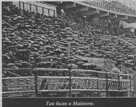
Так было в Майкопе.

Уж и не знаю, доживем ли мы до такого времени, когда люди в России научатся уважать