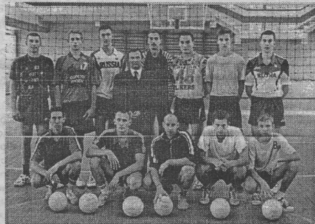
"КРИСТАЛЛ" Воронеж. Сезон 1996-1997 гг.

В следующем номере мы опубликуем состав трех сильнейших дивизионов российского чемпионата и календарь встреч с участием "Кристалла".