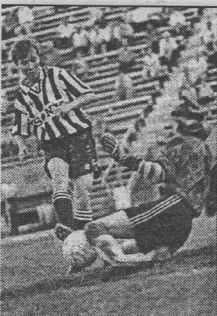
мячей плюс 2 послематчевых пенальти.

В розыгрышах Кубка лучшей футболисткой России забивала