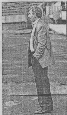
Иван Васильевич, кривил ли душу?