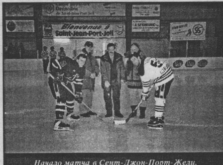
Начало матча в Сент-Джон-Порт-Жели.

городе Римукусы сразились с местной юниорской командой. Было много драк, силовой борьбы, но мы оказались выше класса, хотя по росту-весовым характеристикам канадцы выглядели предпочтительнее. Со второго периода ХК "Воронеж" вел 5:4, а завершилась встреча со счетом 12:4. Просто канадские ребята, даже более старшего возраста, ничего не могут противопоставить нашей хоккейной школе. В Канаде не принято форсировать подготовку в юношеском возрасте. Система выстроена так, что будущие Гретцки и Лемье все равно нигде не денутся и про-