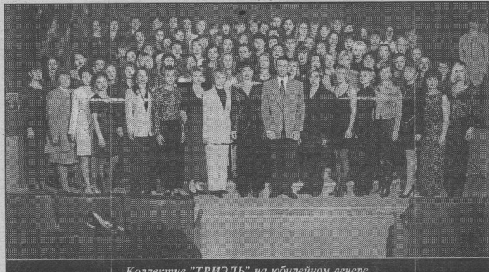
Коллектив "ТРИЭЛЬ" на юбилейном вечере.

"Мальорка" - 32, "Сельта" - 31, "Валенсиа" - 29, "Атлетико" - 29, "Барселона" - 28, "Реал" - 28, "Атлетик" - 26, "Реал Сосьедад" - 25, "Сарагоса" - 25, "Овьедо" - 25.