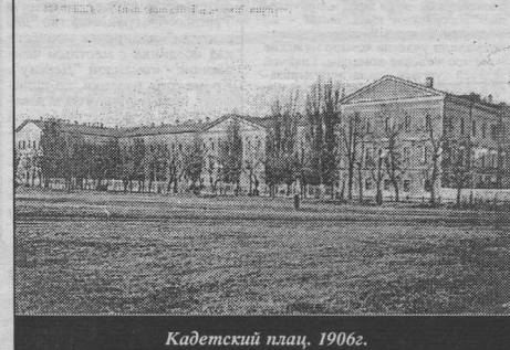
Кадетский плац, 1906г.