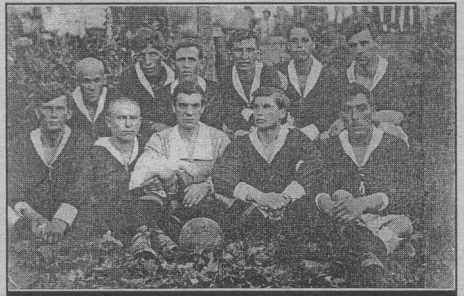
"Фортуна" Воронеж. Начало 20-х годов.

Следующий 1922 год выдался для страны трудным и голодным, сократилось число спортивных состязаний. Вероятно, мало было в Воронеже и футбольных