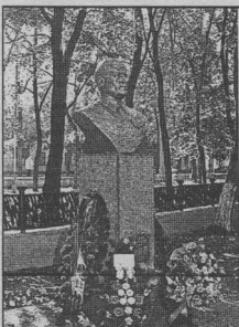
Земляки помнят Михаила ЕМЕЛЬЯНОВА ВАЙЦЕХОВСКОГО.

- Я был приятно удивлен их качеством, впервые столкнувшись с российскими патронами. Теперь буду стрелять только ими.