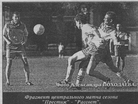
Фрагмент центрального матча сезона "Престиж" - "Рассвет".