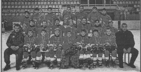
со счетом 4:3, завоевали главный приз. Кубок "Спартак", золотые медали и грамоты ребята вручили прославленному мастеру хоккея