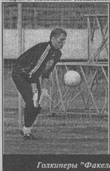
Голкиперы "Факела" пока не выгручают.