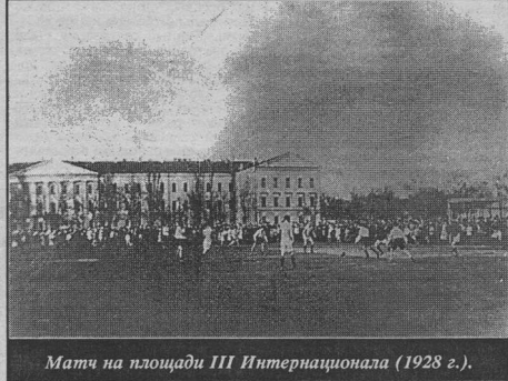
Матч на площади III Интернационала (1928 г.).

Воронеж - Самара 4:0 (2:0). Голы: 1:0 (8, с пен.), 2:0 (22), ... Судья Герцен. 24 сентября. 5000 зрителей. Воронеж - Челябинск 3:0 (0:0). Голы: 1:0 - Скоропупов (57), 2:0 - Михеев (83), 3:0.