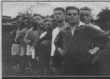
Сборная Воронежская (1935 г.).

Все чемпионы Воронежской области: 1935, 1936 - сб. Воронежская; 1937 - "Пищевик"; 1938, 1939, 1940, 1947, 1951, 1957 - "Динамо"; 1940 - "Крылья Советов"; 1948, 1950 - клуб им. Ворошилова; 1949, 1953 - Сталкинский район; 1952 - "Торпедо" (Липецк); 1954 - ОДО; 1955 - "Спартак"; 1956,