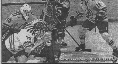
"Воронеж" оборонялся всей командой.