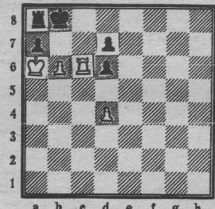
Диаграмма 2. Ход белых. Выигрывает.

Диаграмма 1. Белые начинают и выигрывают.