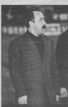
В. ГАЗЗАЕВ наблюдает за игрой с трибуны.