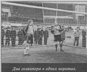
Два голкипера в одних воротах.