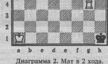
Диаграмма 2. Мат в 2 хода.