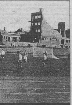
Стадион "Пищевик" в руинах.

В первенстве Центральных Советов своих ДСО участвовали воронежские коллективы "Спартак" (в 1936 г. зональный турнир проводился в Воронежске), "Динамо" (в 1940 г. финал состоялся в Воронежске), "Локомотив", "Пищевик", "Стрела", "Крылья Советов". В первенстве