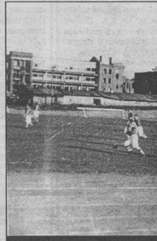
Стадион "Пищевик" в руинах.

Появление ДСО привело к созданию большого количества футбольных команд. Почувствовала на себе это и Воронежская область. Возросло количество участников областного и городского первенств. Мощным футбольным центром по-прежнему оставался Воронеж, но уже в те годы конкуренцию ему могли составить Тамбов, Липецк, Елец, Борисоглебск, Калач, Алексеевка, Свобода (ныне - Лиски). В довоенные годы за звание чемпионов области боролись также команды Мичуринска, Моршанска, Семилук, Рамони, Грязей, Эртиля, Боброва, Богучара, Россоши, Усмани, Евлдаково, Ольховатки, Бутурлиновки, Елань-Колыба и других райцентров. Соревнования проходили по олимпийской системе, и поэтому в финале обычно встречались воронежские коллективы.