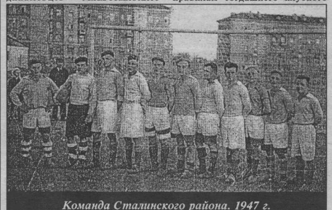
Команда Сталинского района. 1947 г.

А началось все с того, что авиазавод № 18 после войны не вернулся в родной город из Куйбышева. На его месте было создано новое предприятие. Вместе с ним появилось новое ДСО, а весной 1947 года и новая футбольная команда. По всем правилам тогдашнего клубного