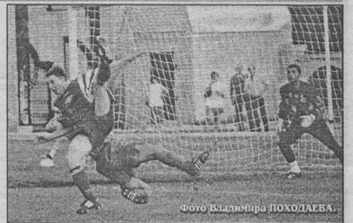
7 мая. Новомосковск. Стадион "Дон". 1500 зрителей. 18 градусов.