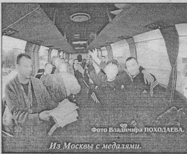
Из Москвы с медалями.

- На протяжении всего чемпионата "Энергия" показывала высокую результативность, но в то же время немало пропускала. Как планируете решать эти проблемы?