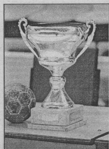
Кубок чемпиона России.

Весь наш разговор сводится к одному вопросу - в каком состоянии подойдут наши спортсмены к еврокубкам? Убежден, что задавать его нужно уже сейчас, дабы не упустить драгоценное время. Ну а пока хотелось бы искренне поздравить игроков, тренеров, руководство "Энергия" с бронзовыми медалями и завоеванной путевкой в еврокубки. Думается, это результат по достоинству оценят в Воронеже.