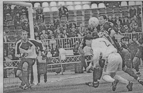
В борьбе на "втором этаже" "Факел" проиграл все.

Вы согласны с тем, что с середины второго тайма "Ротор" заиграл в свое удовольствие? - Сказался счет 2:0. В перерыве решили поменять тактику: отдал инициативу, чтобы "Факел" раскрялся, а самим сыграть на контратаках. Я думаю, что нам это удалось, особенно в концовке. Поэтому счет 4:0 - закономерен.