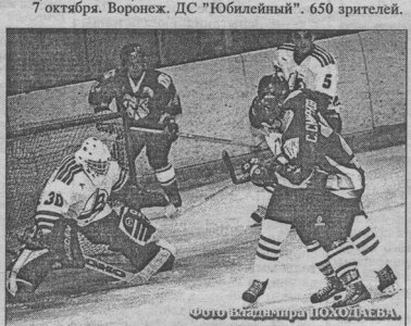
КЛАССИЧЕСКАЯ ПОБЕДА ХОЗЯЕВ

7 октября. Воронеж. ДС "Юбилейный". 650 зрителей.