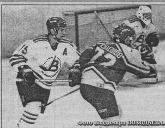
Виктора Тихонова впервые уступили дома в овертайме 1:2.