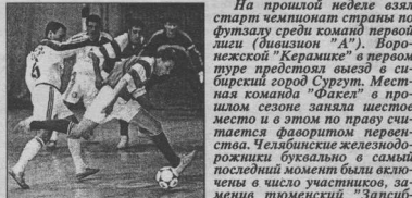
На прошлой неделе взял старт чемпионат страны по футболу среди команд первой лиги (дивизион "А"). Воронежской "Керамика" в первом туре против ярославского "Локомотива" со счетом 1:0. Местная команда "Фабус" в прошлом сезоне заняла шестое место в чемпионате. В последнем матче были объявлены в число участников, заменив тюменский "Запсибкомбанк". А команда из Курма и она является одним из старожилых команд в лиге - здесь и сейчас не хватает, но и спортив может преподнести в любом матче.