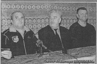
ФОТО ИВАНОВА И ПИРОЖИ

Собственно об игре спрашивать, согласитесь, было глупо - настолько очевидной оказалась разница в классе команд. Поэтому у тренера боснийцев, а основном, выясняли историю их клуба, а воронежский наставник больше говорил о будущих баталиях.