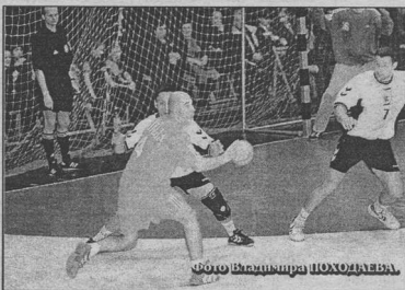
ФОТО ИЛМАЗОВИЧ ПИРОЖИ

Энергия: Макин (Кривоко), Мочалов (9), Раховский (3), Калараш (3), Кисленков, Тарасенко (1), Растворцев (7), Дороникин (2), Зелинский (4), Голомелов, Чесноков (5). Кривая: Хаджисашич (Шабанович), Шабич, Ридичи (12), Басич (1), Пашар (3), Бркич (2), Яскич, Дикочкич (4), Терзиц (1), Хумкич, Толпакович. Удаления: 14 - 14, Семиметровые: 6 (5) - 5 (5). Судья: С.Кот, И.Юдичи (оба - Беларусь). 17 ноября. Воронеж. СОК "Энергия". 1500 зрителей.