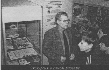
Экскурсия в самом разгаре.