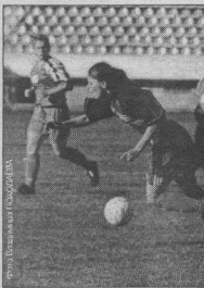
В. КОШАРЕВ

выла в шапке. К сожалению, в конце тайма она получила небольшую травму и вынуждена была покинуть поле. Но ушла Зинченко, запасав на свой счет забитый гол. Произошло это 33-й минуте. А до этого момента «Энергия» уже дважды оторвала норвежек. Открыла счет Карасева на 12-й минуте, уже вскоре ее уловила Емельянова, отличившаяся также и на 36-й минуте.