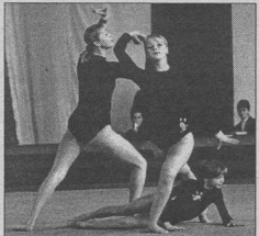
Воронежские акробаты довольствуются «серебром»