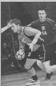
В. КОШАРЕВ

Очень хорошо у хозяев сыграл Перич - 27 сейвов. Про такое обычно говорят «вытащил» все. У воронежцев в отрыве очень низким процентом реализация атакатов Растворев,