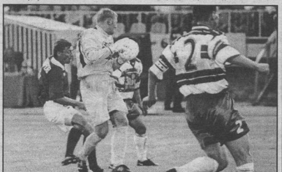
2001 год, Воронеж, высший дивизион. «Факел» устраивала ничья, но побежа забивать, воронежцы ее упустили