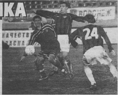
Оборона "Амкара" подтвердила репутацию одной из самых надежных в дивизионе: после двух матчей на выезде ворота пермяков остаются нераспечатанными