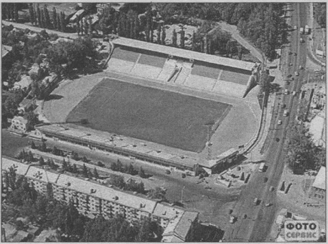
Стадион-красавец Белгорода к первому дивизиону готов!