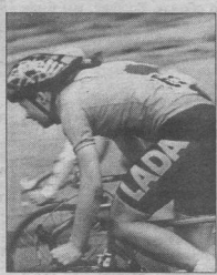
танции хотя бы на одном этапе, автоматически отстранялись от дальнейшего участия в гонке. В итоге, в последний день стартовало чуть более 80-ти спортсменов.

Из всех 120 участников до финиша многодневки дошли не все. Те, кто сошел с дис-