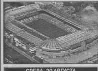
СРЕДА, 20 АВГУСТА