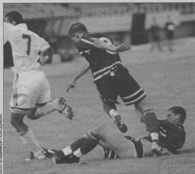
Редкий аутсайдер не разденот «Факел»...