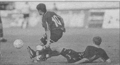
Хабаровчане не позволили хозяевам создать ни одного голевого момента

Предупреждения: Ельшев, 66. Рыжик, 66. Лапин, 71. Джорджевич, 73. Удален: Ельшев, 87 - 2х. Время матча: 95:21, 1-й тайм - 45:55, 2-й тайм - 49:26. Судьи: В. Лушин (Сочи) - 8,8. В. Дроздов (Москва) - 9,0. В. Архипов (Ульяновск) - 9,0. Инспектор Ю. Кабан (Москва). 28 августа. Воронеж. Центральный стадион профсоюзов. 7000 зрителей. 21 градус.