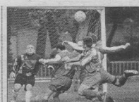
ФУТБОЛ. Чемпионат Воронежской области / Первая группа