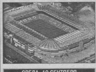
СРЕДА. 10 СЕНТЯБРЯ

ЦСК ВВС - ХК «Воронеж» 3:3 (0:0, 1:1, 2:2, 0:0) буллитами 2:1. Штраф: Бороздин (Воронин), 30:25