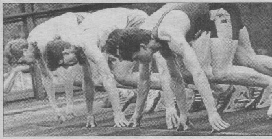
ИТОГИ 9-го ЧЕМПИОНАТА МИРА ПО ЛЕГКОЙ АТЛЕТИКЕ

Посмотрим теперь итоги по странам континентам. С Россией и Штатами разобрались. Добавим, что американцы свой лучший результат показали в Штутгарте-93: 26 медаль (13-7-6). СССР наибольшее число медалей в Токио-91: 28 медалей (9-9-10). Интересно, что сейчас «постсоветское пространство»,