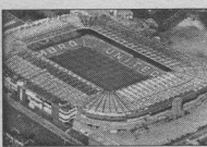
СРЕДА, 17 СЕНТЯБРЯ

СПОРТ 06:05 Хоккей. Чемпионат России. Суперлига. «Динамо» (Москва) - «Севастополь» (Черновлеы) 08:10 Футбол. Чемпионат России. «Рубин» (Казань) - «Шинник» (Ярославль) 10:40 Футбол. Кубок обладателей кубков Европейских стран. 1/2 финала 12:10 Футбол. Чемпионат России. «Сатурн Рязань» (Московская область) - «Спартак-Алания» (Владикавказ) 14:15 Хоккей. Чемпионат России. Суперлига. «Динамо» (Москва) - «Севастополь» (Черновлеы) 16:10 Футбол. Чемпионат России. «Ротор» (Волгоград) - «Зенит» (Санкт-Петербург) 18:25 Хоккей. Чемпионат России. «Ак Барс» (Казань) - «Химик» (Московская область) 20:55 Конкур. «Суперлига-2003» 22:00 Хоккей. Чемпионат России. Суперлига. «Металлург» (Магнитогорск) - «Севастополь» (Черновлеы)